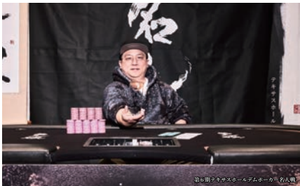
第6期7人オマハポーカー大会 名人戦